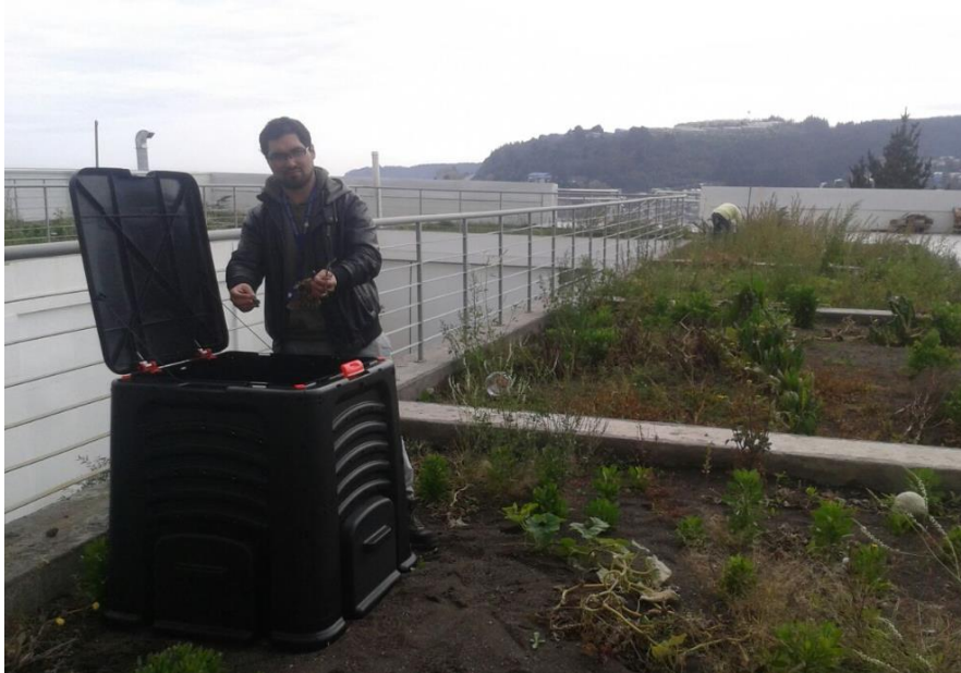
En esta fotografía se muestra al Técnico Ambiental de hospital segregando residuos orgánicos al interior de una de las composteras.