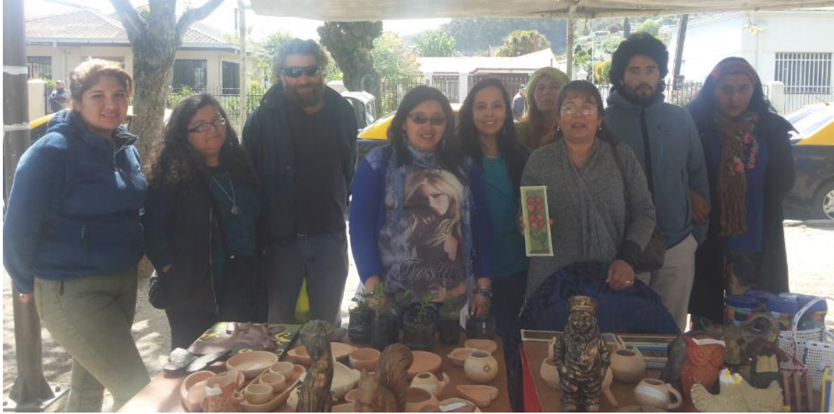
Agrupación Nuevo amanecer.

El personal de la central de alimentación, son los que reciben los alimentos por parte de la Agrupación “nuevo amanecer” y las preparan en alimentos para funcionarios y pacientes.