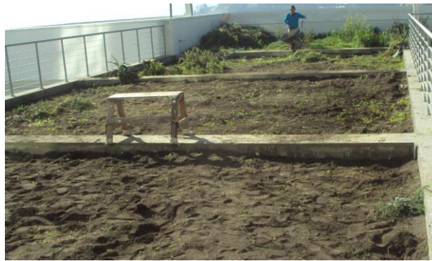
En esta fotografía se muestra al personal de gendarmería realizado la limpieza del terreno así lo prepara para la plantación.

Otro participante importante en este proyecto es el convenio realizado con gendarmería, en donde las personas que cumplen pena remitida tienen que prestar servicio a la comunidad. El Hospital de Penco Lirquén les abre las puertas a esta nueva medida de inserción social incorporando a estas personas en el trabajo de la tierra, preparando las terrazas, desmalezando y otras actividades que el técnico ambiental del hospital les asigne.