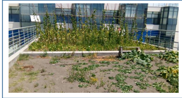
Imagen de las terrazas en el Hospital de Penco Lirquén.