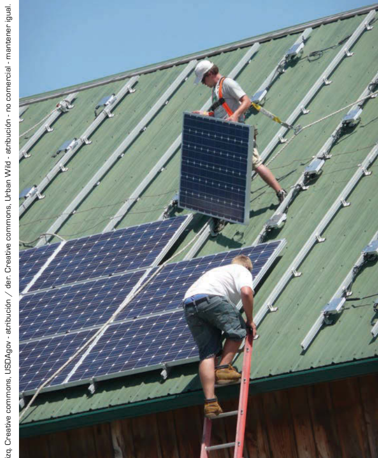
105 PANELES SOLARES SON INSTALADOS EN UN HOSPITAL DE LITTLESTOWN, PENSILVANIA, EE.UU., 2010.