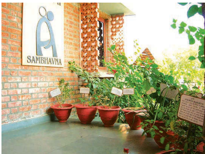
izq. y der. Creative commons, Jessie Bhangoo - atribución - mantener igual.

Para esto se puede utilizar la Guía para la eliminación de mercurio en establecimiento de salud 9 , un documento desarrollado por Salud sin Daño que pretende ser una herramienta sencilla y útil para la implementación de planes de eliminación de mercurio en hospitales.