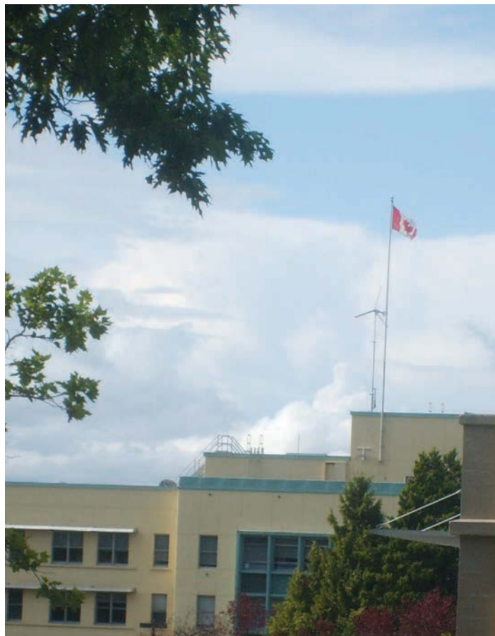
TURBINA EÓLICA EN BC CHILDREN'S HOSPITAL & BC WOMEN'S HOSPITAL, CANADÁ.

El procedimiento habitual de trabajo de la mayoría de los hospitales requiere un consumo de energía considerable (para el calentamiento del agua, los controles de la temperatura y la humedad del aire en interiores, la iluminación, la ventilación, etc.) lo que produce varios resultados negativos: considerables emisiones de gases de efecto invernadero y otras sustancias tóxicas, consumo de recursos no renovables, entre otros impactos