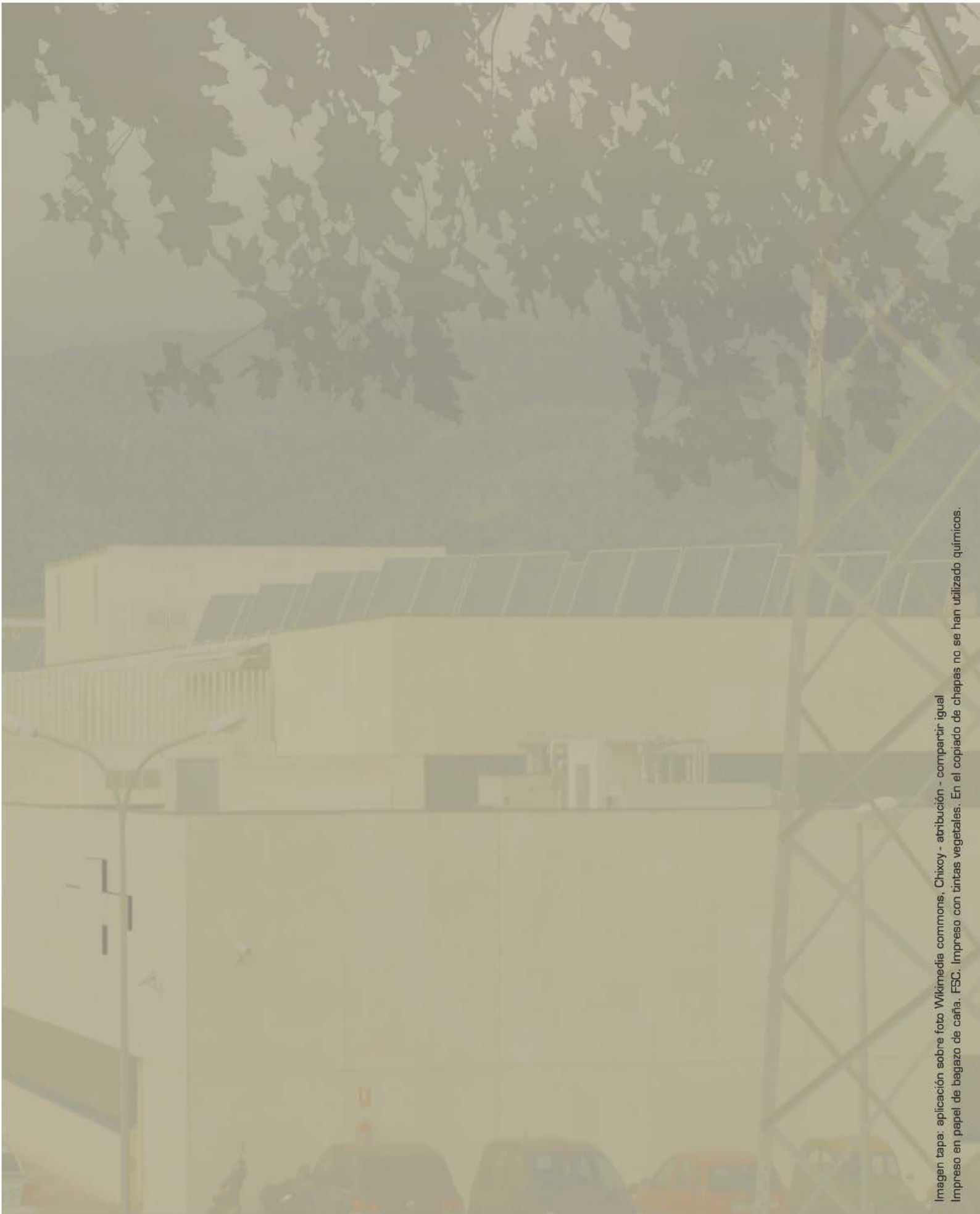
Impreso en papel de bagazo de caña, FSC. Impreso con tintas vegetales. En el copiado de chapas no se han utilizado químicos.